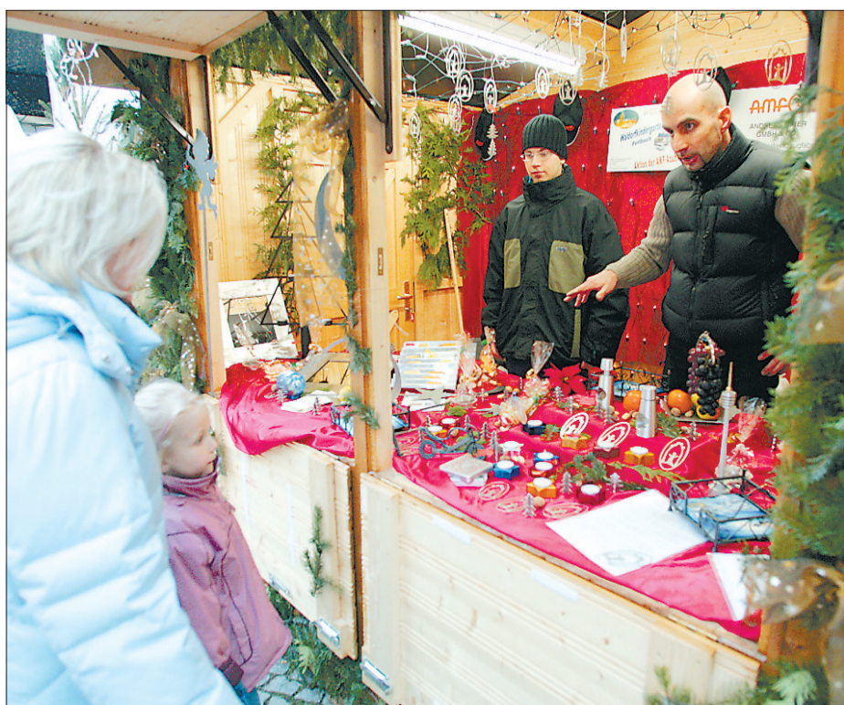
Selbst produzierte Geschenke haben die AMF-Azubis verkauft.

INFO: Weitere Informationen gibt es im Internet unter www.glatze-locke.de . Für die Aktion 6666 gibt es Sonderkonten bei der Kreissparkasse Fellbach, Konto 2 189 352, BLZ 602 500 10, und bei der Fellbacher Bank, Konto 807 010, BLZ 602 613 29. Für Spenden über 50 Euro stellt die Arbeiterwohlfahrt automatisch eine Spendenbescheinigung aus, bis 50 Euro akzeptiert das Finanzamt den Überweisungsbeleg.