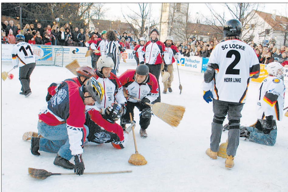
Für die gute Sache legen sich die Teams von „Glatze“ und „Locke“ wieder ins Zeug.